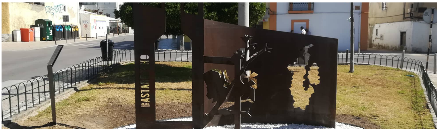
Inauguração do monumento "Ao Bastardinho" no Lavradio | 28 de setembro 2019