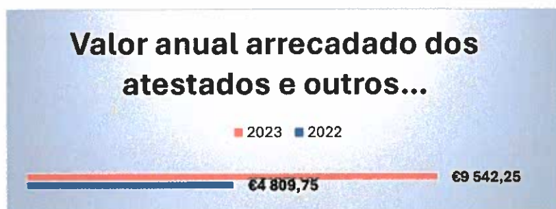
Gráfico 3 – Valor anual arrecadado dos atestados e outros documentos emitidos

Em 2023 o valor arrecadado no âmbito dos atestados e de outros documentos (confirmações de agregado familiar em impresso próprio) emitidos registou um aumento de cerca de 98% face ao valor registado em 2022.