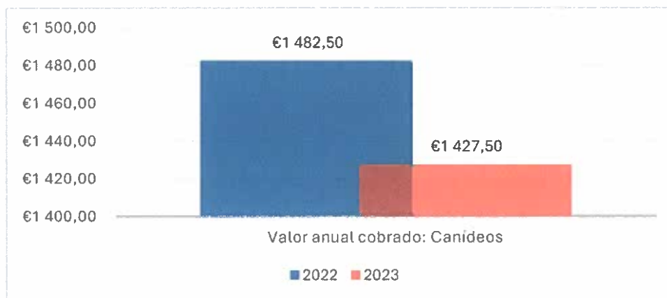
Gráfico 4 – Licenças de canídeos 2022 vs 2023

No que enleia ao licenciamento dos canídeos, em 2022 (169 licenças) foram emitidas mais 15 licenças do que em 2023 (154 licenças) tendo sido arrecado em 2022 mais 55€ do que em 2023.