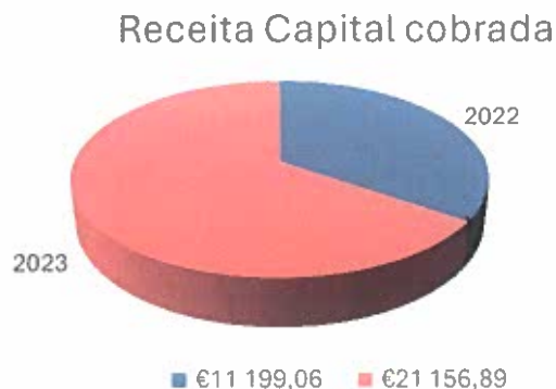
Gráfico 1 – Receita de capital cobrada 2022 vs 2023

Quanto à receita de capital efetiva, no ano de 2022 a UFBL arrecadou menos 9 957,83€ face a 2023.